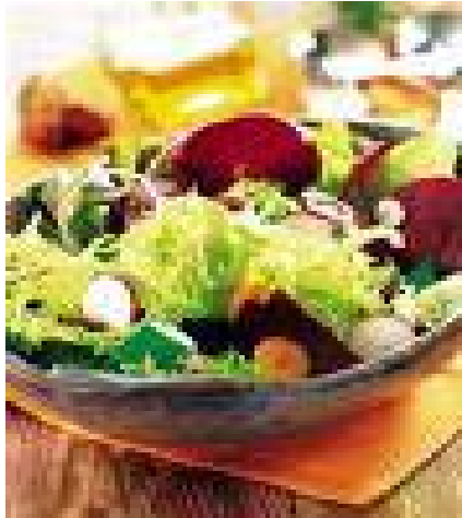
■ Mesa de ensaladas

Queremos comunicarles que el Menú incluye diariamente: