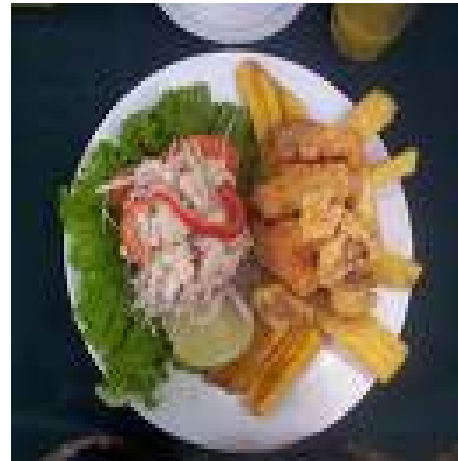
■ El plato del día o su opción*