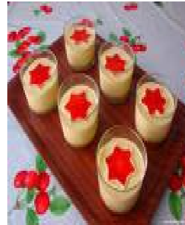
■ Postre o