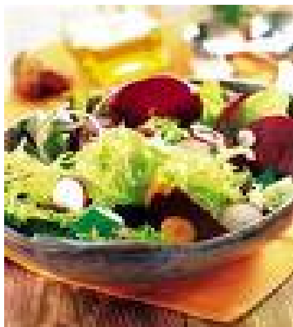
■ Mesa de ensaladas

Queremos comunicarles que el Menú incluye diariamente :