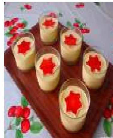
■ Postre o