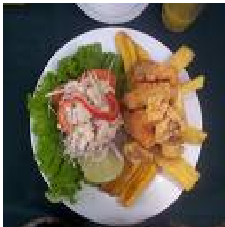
■ El plato del día o su opción*